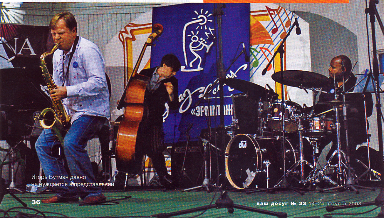
Игорь Бутман давно не нуждается в представлении

На свете около тридцати стран, где официально запрещен джаз. Среди них Саудовская Аравия, Судан, Ливия и Восточный Тимор. Как это ни странно, в Иране, к примеру, джаз играют