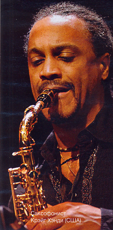
Саксофонист Крейг Хэнди (США)

На одиннадцатом по счету международном фестивале «Джаз в саду «Эрмитаж» соберутся признанные звезды из 9 стран мира. В течение 3 дней они предоставят москвичам уникальную возможность послушать самую позитивную музыку на земле