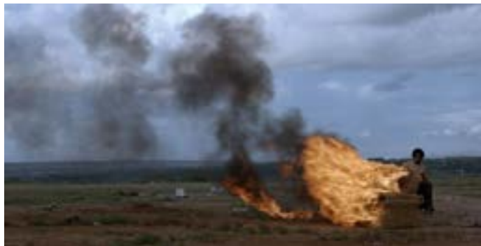
Branco sai. Preto fica

21h, Leo Maia, pelo projeto Os filhos dos caras. Teatro I do CCBB (SCES, Tr. 2). Informações: 3108-7600. Ingressos: R$10 e R$5 (meia). Classificação livre.