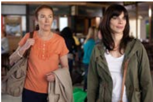
Quinze anos e um dia

19h30, Quinze anos e um dia (2013, 96min, dir. Gracia Querejeta), pela mostra Olhares femininos através das lentes espanholas . Instituto Cervantes (SEPS 707/907, Lt. D). Informações: 3242-0603 e 8417-8167. Classificação: 12 anos. Entrada franca.