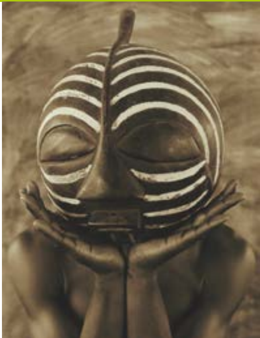
A Máscara Oculta , 18ª Semana da Francofonia

de 17 de março a 30 de abril , das 10h às 19h, A Máscara Oculta . Mostra de trabalhos do fotógrafo belga Kristof Degrauwe baseada na coleção de máscaras “escondidas” nas lojas do museu etnográfico de Lubumbashi (República Democrática do Congo), pela 18ª Semana da Francofonia . Espaço Cultural Ernesto Silva (Aliança Francesa, SEPS 708/907, Lt. A). Informações: 3262-7600. Classificação livre. Entrada franca.