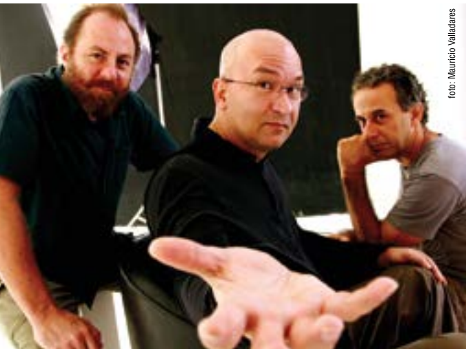
Paralamas do Sucesso

22h30, Paralamas do Sucesso e Titãs, no Brasília Rock Show. Ginásio Nilson Nelson (Eixo Monumental). Informações: 3342-2232. Ingressos (inteira): de R$100 a R$200. Classificação: 18 anos.