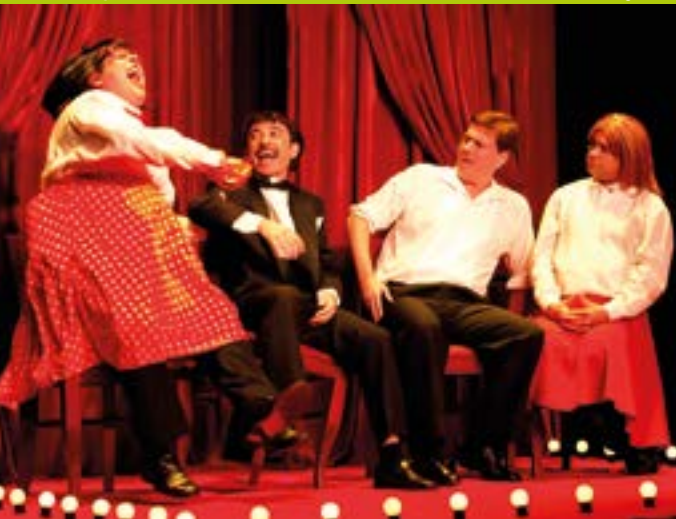
Sexo - a comédia

19h, Ensaio geral. Discorrendo de forma não convencional sobre as várias facetas da palavra “amor”, o espetáculo traz um apanhado de textos de Charles Chaplin, Drummond, Hilda Hilst e outros. Direção de Hugo Rodas. Teatro da Caixa Cultural (SBS, Qd. 4, Lt. 3/4). Informações: 3206-9448. Ingressos: R$20 e R$10 (meia-entrada válida também para doadores de 1kg de alimento). Classificação: 16 anos.