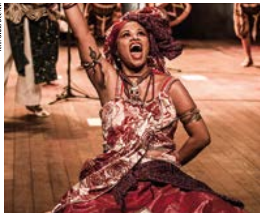
Afrolatinidades - Ilú Obá de Min, 2013

de 9 a 18 de março , de segunda a sexta, das 12 às 19 horas, Santas Mulheres , obras do artista André Lafeta, em homenagem ao Dia Internacional da Mulher. Espaço Desembargadora Lila Pimenta Duarte (Memorial TJDF, Praça Municipal, Lt, 1, Bl. A, 10º andar, Ala A). Informações: 3103-5894. Classificação livre. Entrada Franca.