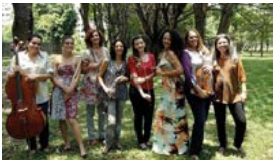
Orquestra de Senhoritas

17h, Orquestra de Senhoritas, pelo projeto Taguatinga in concert. Praça de Vidro do Taguatinga Shopping (QS 1, R. 210, Lt. 40, Pistão Sul, Taguatinga). Informações: 3451-6000. Classificação livre. Entrada franca.