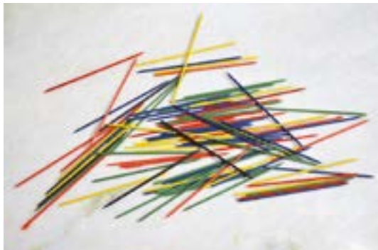
Experiência e Tumulto III - Wagner Barja

até 20 de abril , de quarta a segunda, das 9h às 21h, Experiência e Tumulto III . Antologia dos 30 anos da produção do artista plástico Wagner Barja. Galeria 2 e Pavilhão de Vidro I do CCBB (SCES, Tr. 2). Informações: 3108-7600. Classificação livre. Entrada franca.